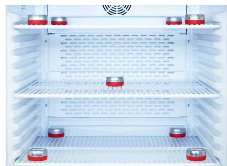
Kundenspezifische 9 Punkt-Kalibrierung Etalonnage spécifique au client avec sonde 9 points