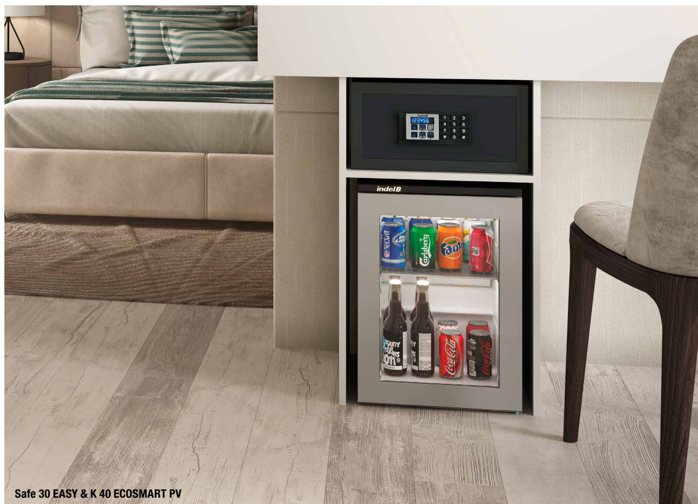
Safe 30 EASY &amp; K 40 ECOSMART PV

Verkaufsunterlagen / Prospectus : Indel B Hospitality solutions