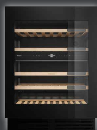
WCN 25842 G ▲+ CHF 3390.-/3135.99