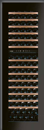
FBW 601782 G ▲+ CHF 6490.–/6003.70

▲+ DSM-Plus – Seulement pour les partenaires contractuels avec des conseils exclusifs en magasin