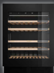
WCN 15842 G ▲+ CHF 2990.-/2765.96