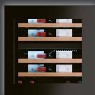
FBW 60602 G ▲+ CHF 3690.–/3413.51