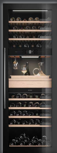
WCN 311942 G ▲+ CHF 9390.-/8686.40

Compresseurs à faibles vibrations – Même de faibles secousses peuvent perturber la maturation des vins et empêcher la sédimentation des tanins. Des compresseurs spécialement conçus pour réduire les vibrations assurent une conservation en douceur des vins dans toutes les caves à vin.