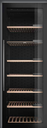
WCN 111942 G ▲+ CHF 7690.-/7113.78