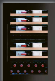
FBW 60882 G ▲+ CHF 3990.–/3691.03